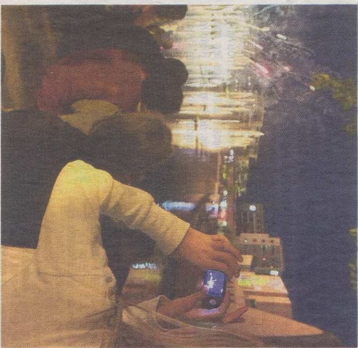
Pour être au plus près de l'événement...

Après quelques extraits de citations élogieuses tirées d'articles consacrés à Tomi Ungerer, sa voix nous parvient. D'Irlande, « il pense à nous », assure-t-il. Avant que ne déferlent sur l'écran des murs du conservatoire les