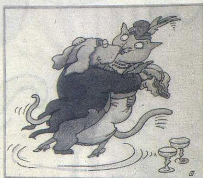
Sans titre, encre de Chine, lavis d'encres de couleur et crayon de couleur sur papier calque, 24,8 x 27,9 cm, s. d. [2002].

Né en 1931 à Strasbourg, Tomi Ungerer mène une carrière internationale de dessinateur et d'illustrateur débutée à New York en 1956. Ses livres pour enfants, auxquels le prestigieux prix Andersen a rendu hommage, ainsi que ses publicités et ses dessins satiriques et politiques ont fait connaître au public une œuvre graphique dont la fantaisie et la créativité ont hissé leur auteur au rang des plus grands dessinateurs contemporains. Tomi Ungerer ne cesse aujourd'hui de mettre les diverses formes de son art au service de l'humanisme, de la tolérance et de la liberté. Séjournant depuis 1975 en Irlande et en France, il a fait don à sa ville natale de huit mille œuvres qui seront régulièrement présentées à partir de l'automne 2007 au Centre de l'illustration Tomi Ungerer à Strasbourg.