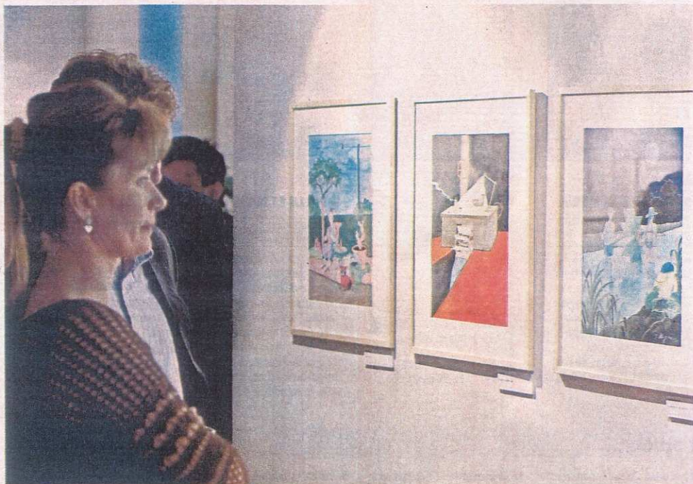
L'exposition des œuvres de Tomi Ungerer réalisées pour Electricité de Strasbourg, déjà passée à Karlsruhe, poursuivra sa route en Hongrie après le 18 juillet.

Strasbourg / Première exposition Ungerer en Europe de l'Est