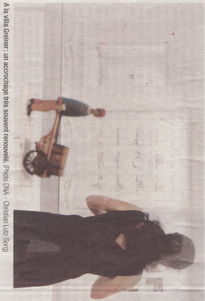
A la villa Greiner : un accrochage très souvent renouvelé.