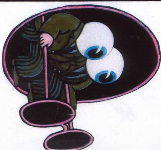
Sans titre, laque d'encre de couleurs sur papier, 29,7 x 21cm, 2007 Copyright : Musées de Strasbourg/Tomi Ungerer

Musée Tomi Ungerer, Centre International de l'Illustration Villa Greiner 2, avenue de la Marseillaise 67076 Strasbourg Cedex Ouvert tous les jours de 12h à 18h sauf mardi Ouvert aux groupes, sur réservation de 9h à 12h Ouverture au public début novembre 2007