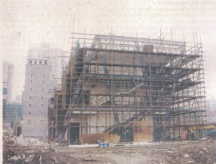
Une vue récente du chantier, en plein cœur du nouveau quartier construit pour l'exposition universelle.

Le dessin de l'ensemble de la structure est dû à un groupe d'architectes prospectant le marché chinois depuis plusieurs années. L'AAADI (Alsace architectural design institute). «Le concept de départ a pu être respecté, assure