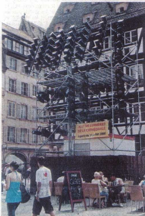
Les préparatifs vont bon train.